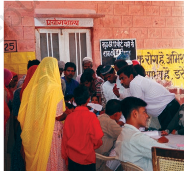
सरकारी अस्पतालों के मरीजों को अकसर ऐसी लंबी लाइनों में खड़े होकर इंतजार करना पड़ता है।

भारत में प्रायः यह कहा जाता है कि हम सबको स्वास्थ्य सेवाएँ प्रदान करने में असमर्थ हैं, क्योंकि सरकार के पास इसके लिए पर्याप्त धन और सुविधाएँ नहीं हैं। पृष्ठ संख्या 14 पर दिए गए बाएँ हाथ के स्तंभ को पढ़ने के बाद क्या आप इसे सही मानते हैं? चर्चा कीजिए।