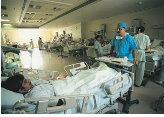
दिल्ली के एक प्रमुख निजी अस्पताल में ऑपरेशन के बाद मरीजों की देखभाल का कर्मरा।

आपके घर के पास कौन-सी निजी स्वास्थ्य सेवाएँ उपलब्ध हैं? उन्हें चलाने वाले लोगों और वहाँ दी जाने वाली सुविधाओं का पता लगाइए।