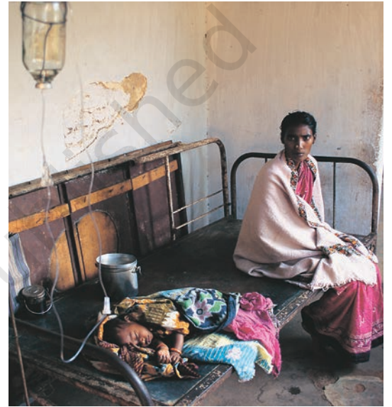
एक सरकारी अस्पताल में अपने बीमार बच्चे के साथ एक औरत। यूनिसेफ़ के अनुसार हर साल 10 लाख बच्चे ऐसे संक्रमणों से मर जाते हैं, जिन्हें रोक पाना संभव है।

किन-किन अर्थों में 'सार्वजनिक स्वास्थ्य व्यवस्था' सबके लिए उपलब्ध एक सेवा है?