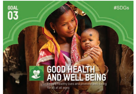
सतत विकास लक्ष्य 3: उत्तम स्वास्थ्य और खुशहाली www.in.undp.org