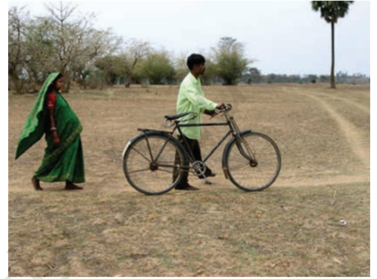
इस गर्भवती औरत को एक योग्य डॉक्टर को दिखाने के लिए कई किलोमीटर पैदल चलना पड़ रहा है।