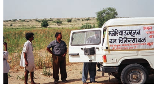
ग्रामीण इलाकों में अकसर एक जीप ही मरीजों के लिए चलता-फिरता दवाखाना बनकर आती है।

इसमें कोई संदेह नहीं है कि हमारे देश में लोगों के स्वास्थ्य की दशा अच्छी नहीं है। यह सरकार का उत्तरदायित्व है कि वह अपने सब नागरिकों विशेषकर गरीबों और सुविधाहीनों को गुणात्मक स्वास्थ्य सेवाएँ प्रदान करे। फिर भी लोगों का स्वास्थ्य, जितना जीवन की आधारभूत सुविधाओं पर और उनकी सामाजिक स्थिति पर निर्भर है, उतना ही स्वास्थ्य सेवाओं के ऊपर भी। इसलिए लोगों के स्वास्थ्य की दशा सुधारने के लिए दोनों पक्षों पर कार्य करना आवश्यक है। ऐसा करना संभव है। अगले पृष्ठ पर दिए गए उदाहरण देखिए —