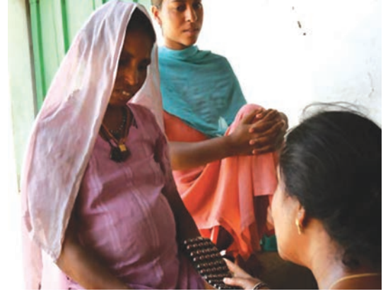
गाँव के एक स्वास्थ्य केंद्र में मरीज को दवाई देती एक डॉक्टर।

हमारे देश में कई तरह की निजी स्वास्थ्य सेवाएँ पाई जाती हैं। बड़ी संख्या में डॉक्टर अपने निजी दवाखाने चलाते हैं। ग्रामीण क्षेत्रों में पंजीकृत चिकित्सा व्यवसायी (आर.एम.पी.) मिल जाते हैं। शहरी क्षेत्रों में बड़ी संख्या में डॉक्टर हैं, जिनमें से बहुत-से विशेषज्ञ की सेवाएँ प्रदान करते हैं। निजी रूप से चलाए जा रहे अस्पताल व नर्सिंग होम भी हैं। काफ़ी संख्या में प्रयोगशालाएँ हैं, जो परीक्षण करती हैं व विशिष्ट सुविधाएँ उपलब्ध कराती हैं, जैसे – एक्सरे, अल्ट्रासाउंड आदि। ऐसी दुकानें भी हैं, जहाँ से हम दवाइयाँ खरीद सकते हैं।